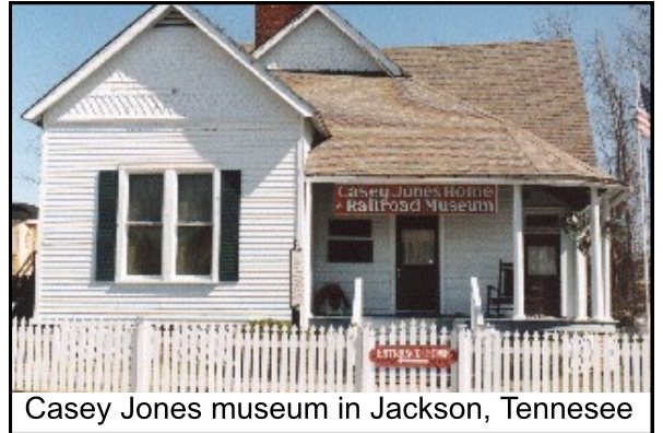
Casey Jones museum in Jackson, Tennessee

Zijn ontmoeting met het noodlot en de rol die Jackson, Tennessee daarin speelde begon in 1884 toen hij in Jackson aankwam en een baan als "flagman" aannam bij de Illinois Central Railroad.