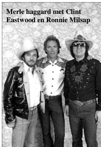
Merle haggard met Clint Eastwood en Ronnie Milsap

Gelukkig kwam Merle tijdens zijn verblijf in San Quentin tot inkeer en besloot hij zijn leven te beteren. Opeens werd de rebel Merle Haggard een modelgevangene. Hij werd voorwaardelijk in vrijheid gesteld in 1960 wegens goed gedrag. Na zijn vrijlating ging Merle als bas / ritmegitarist spelen in een band die optrad in bars en clubs in de "Beer Can Hill", een buurt in Bakersfield. Op deze manier werd zijn leven compleet veranderd.